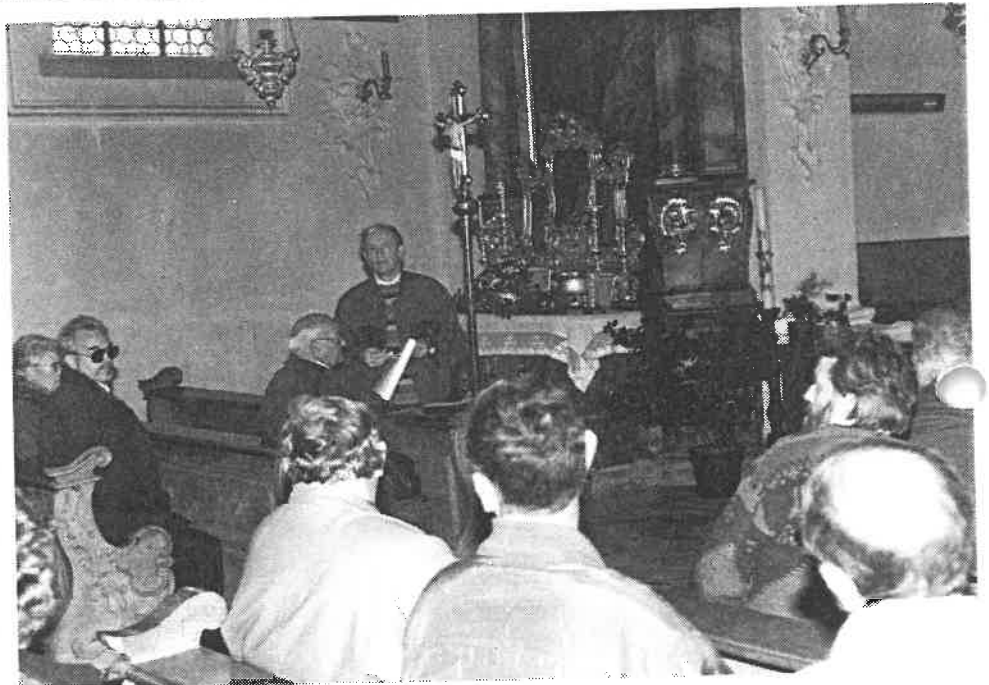
in der katholischen Kirche von Sulzbürg