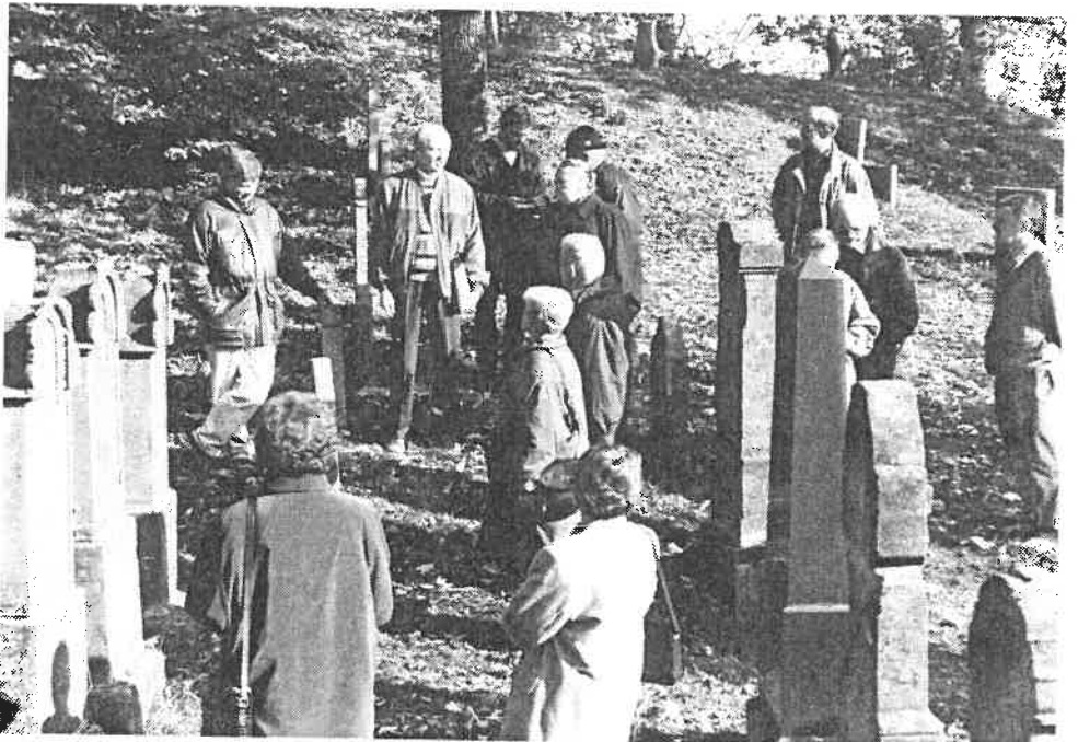
Im Judenfriedhof von Sulzbürg