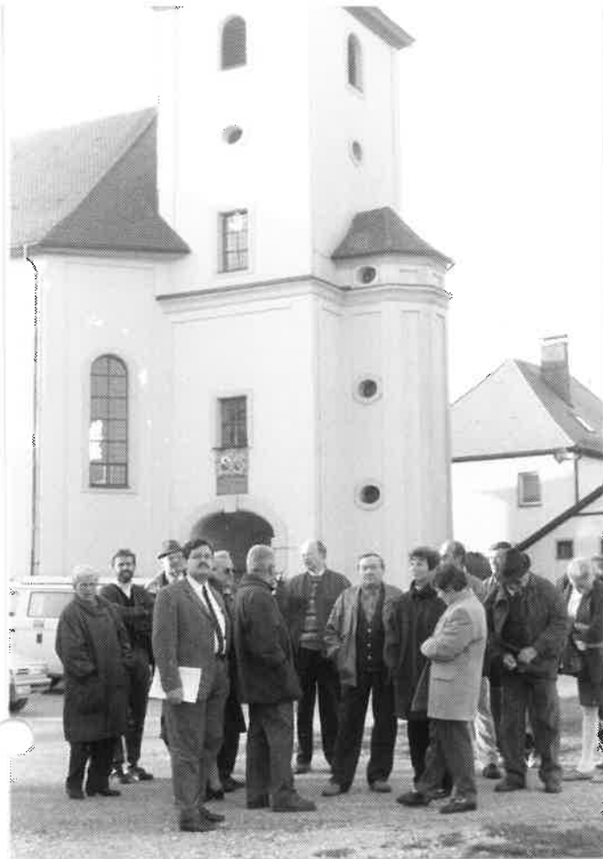
vor der Schloßkirche