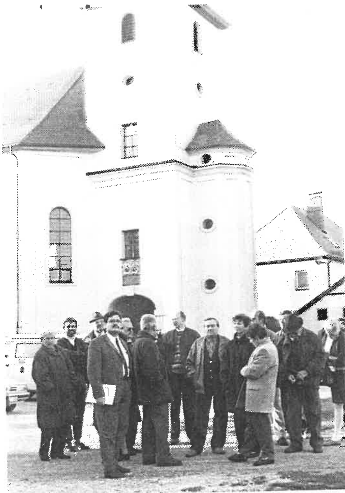
vor der Schloßkirche