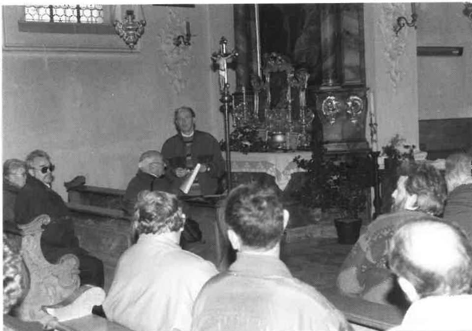
in der katholischen Kirche von Sulzbürg