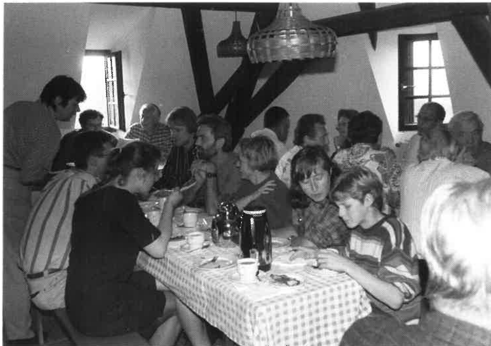
Die Bewirtung war ausgezeichnet!