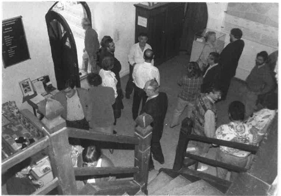
Auch ein Zweck unserer Treffen ist der Gedankenaustausch