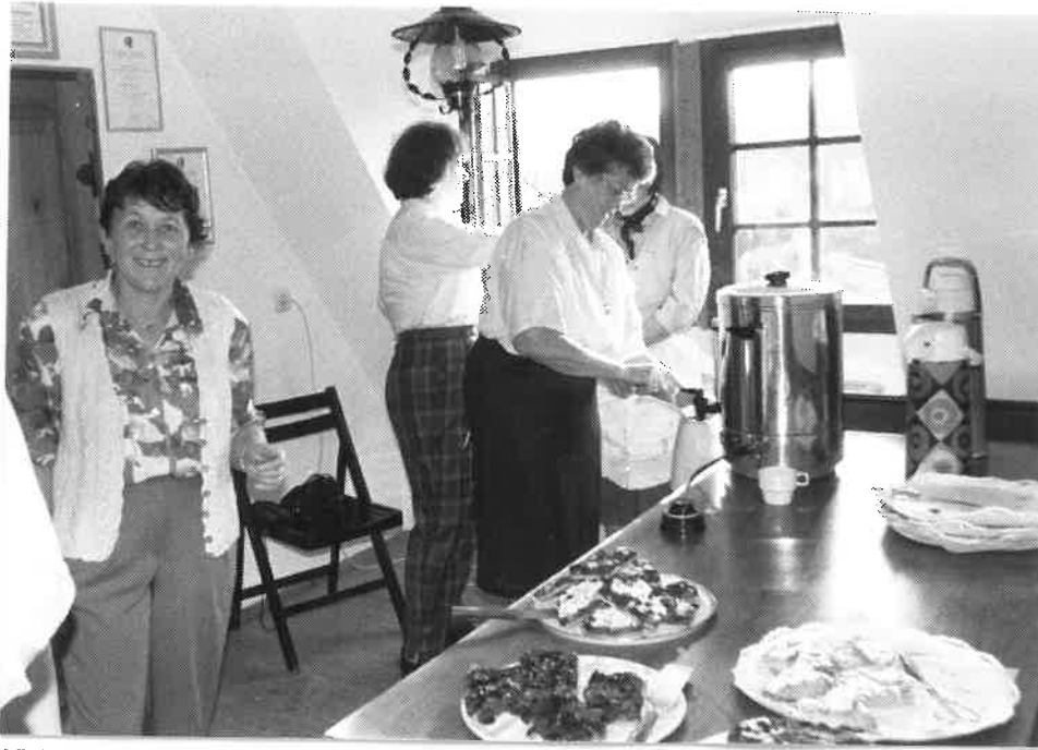
Viele fleißige Helfer versorgten uns freundlich und reichlich