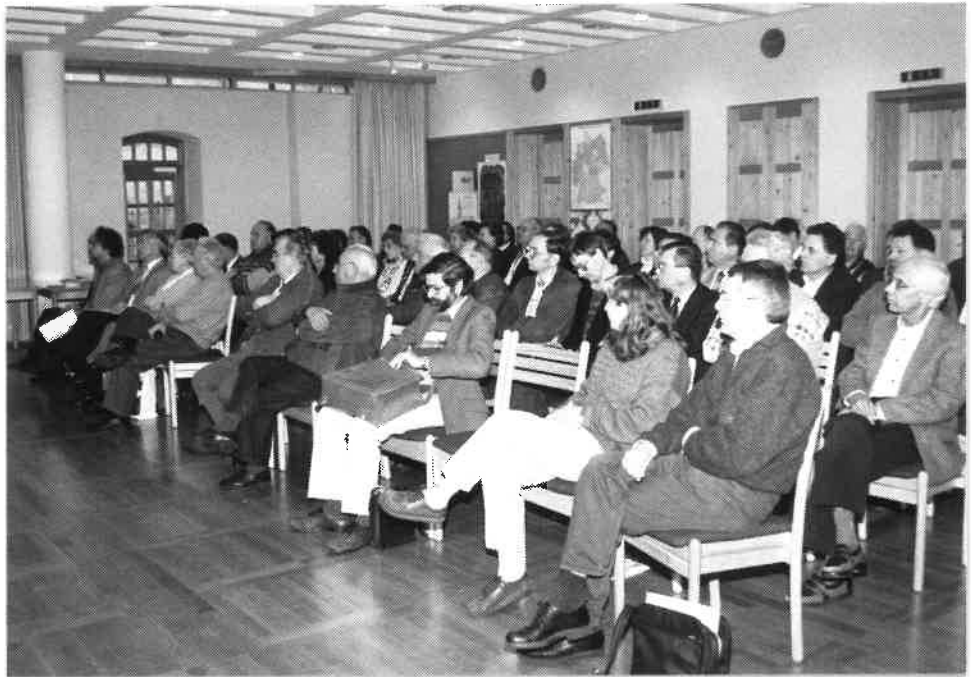
Beginn der Tagung im evangelischen Gemeindezentrum