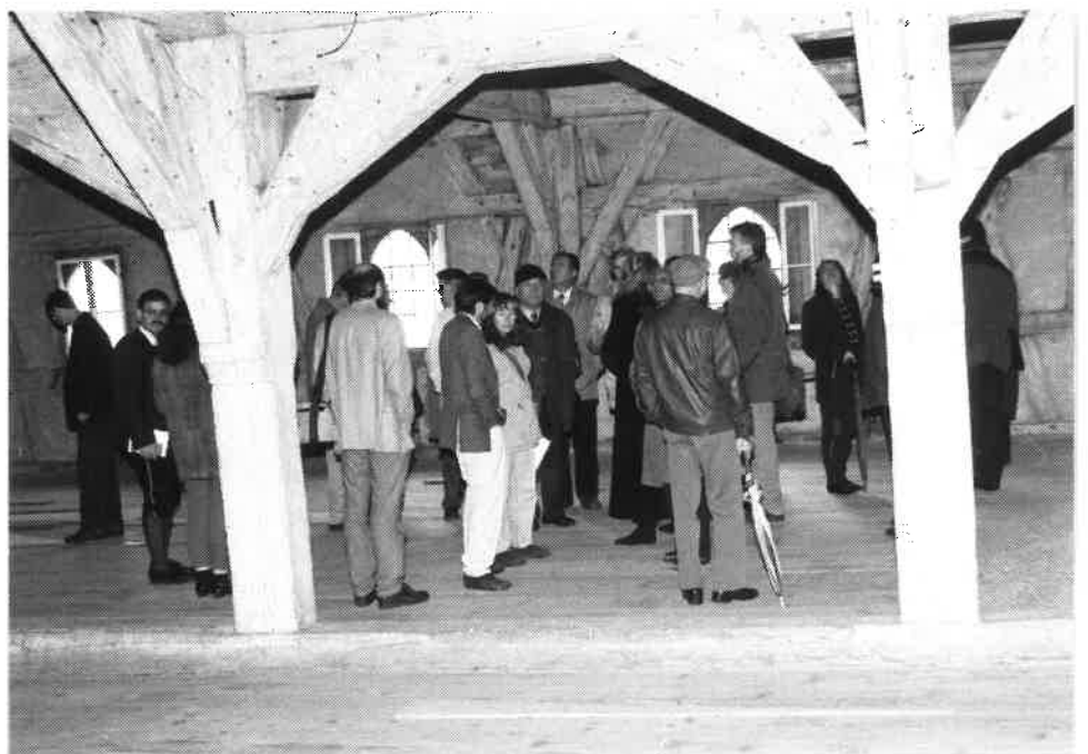
Auf dem Dachboden der Klostermühle

Physikalisch-technisch interessant ist auch der 850 Jahre alte Aufzug, der es ermöglichte, mit verschiedenen Geschwindigkeiten verschieden große Lasten 28 m hoch zu heben.