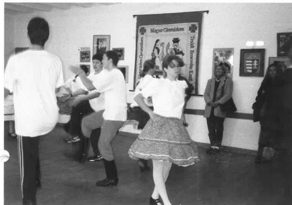
Die Schüler führten uns begeistert ungarische Volkstänze vor. An den Wänden sind kunsthandwerkliche Arbeiten der Schüler und Schülerinnen ausgestellt.