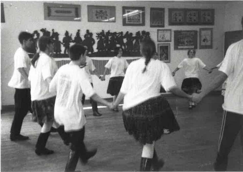
Im Hintergrund sind geschnitzte Halbreiefs zu erkennen, gefertigt in traditionellen Formen.