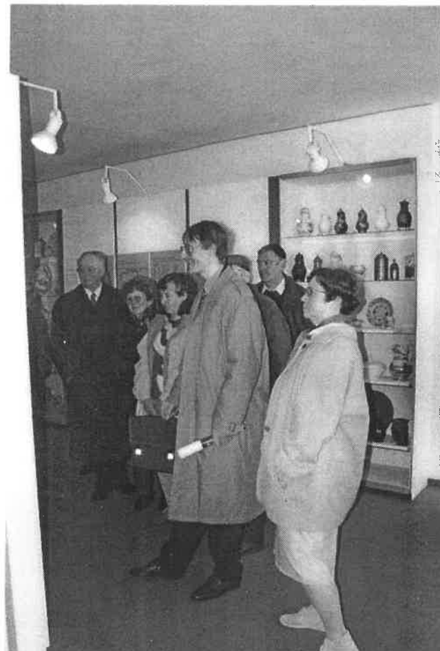
Führung durch das Feuchtwanger Museum