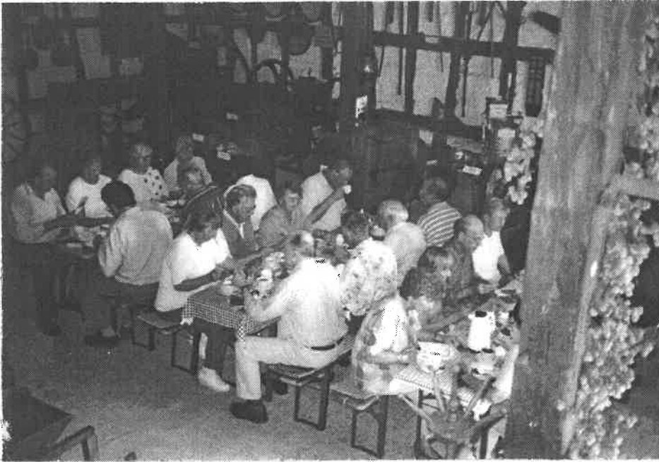
Kaffee- und Teepause in der Hopfenscheune Speikern

ben des Vereins seien, sondern daß in der Vergangenheit z. B. die alte Kersbacher Quellfassung renoviert und ein Gipfelkreuz auf dem Glatzenstein aufgestellt wurde. Auch werden heimatkundliche Bücher veröffentlicht (s.u.).