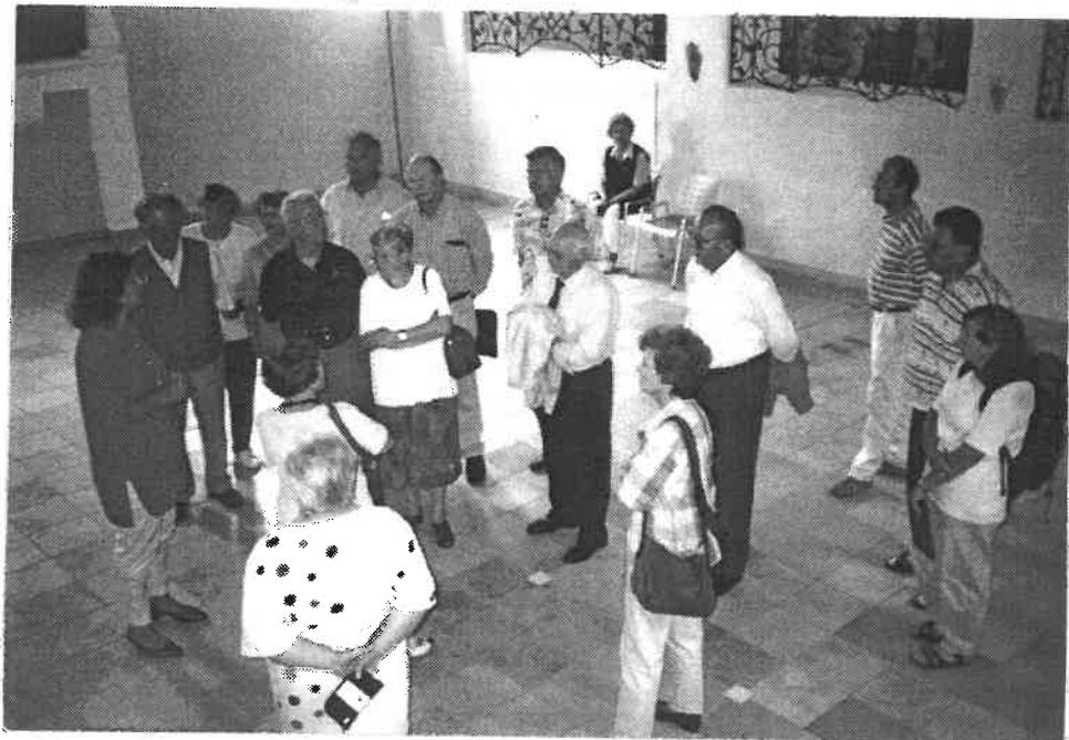
In der Schnaittacher Synagoge

erste Raum widmet sich der Geschichte der jüdischen Gemeinden in der ehemaligen Herrschaft Rothenberg. Ganz originell: Durch ein Guckloch kann man einen Blick auf die Festungsruine Rothenberg werfen. Im 2. Raum geht es um die Geschichte der Judaica-sammlung, wobei hier hingewiesen wird auf den Hafnermeister Gottfried Stammler, der während des Novemberprogramms 1938 die Zerstörung des Synagogengebäudes verhinder-