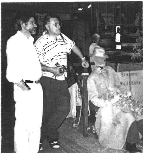
Die zwei Vorsitzenden

Küche, Waschen. Im 3. Stock (Spitzboden der Scheune) werden die Themen Feuerwehr und Ortsgeschichte (Ausstellungsgegenstände von örtlichen Firmen und Vereinen, Nachbildungen und Fundgegenstände der vorgeschichtlichen Zeit) aufgezeigt.