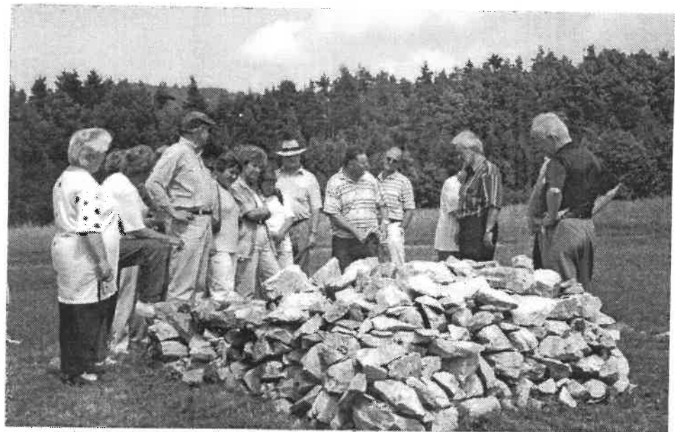
Informationen über den Nachbau eines Grabhügels

Fundflächen, und er soll die Schönheit der Landschaft bewundern können. Viele schöne Ausblicke bieten sich bei der Durchwanderung des Weges". Wir besichtigten nur einen Bruchteil des Weges: Die Hügelgräber im Schallerholz und die dazugehörige Rekonstruktion auf der Wiese oberhalb. Dr. Mühldorfer von der Naturhistorischen Gesellschaft Nürnberg gab jeweils geschichtliche Erläuterungen dazu. Den Höhepunkt des Wanderweges