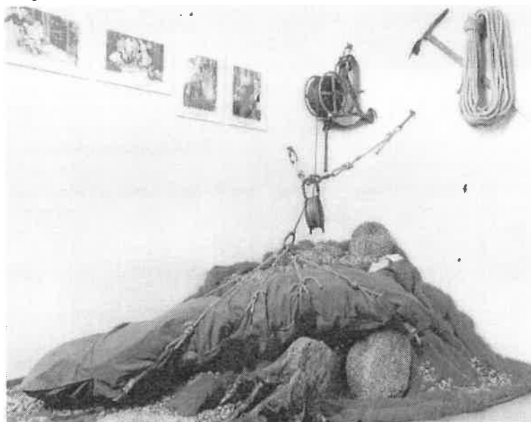
Die Inszenierung einer Sommer-Rettung der Bergwacht aus früheren Tagen gefiel uns.

Aufgrund des Kassenprüfberichts und des Berichtes über das Geschäftsjahr stellte Herr Gsänger den Antrag auf Entlastung der Gesamtvorstandschaft. Die Mitgliederversammlung erteilte die Entlastung einstimmig unter Enthaltung der anwesenden Vorstandsmitglieder.