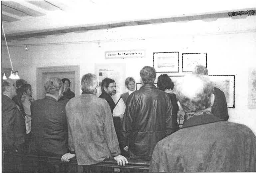
Im Raum mit der Darstellung Zirndorfs in der Zeit des 30jährigen Kriegs

den Verkauf förderten. Kleine Firmen, die sich den globalen Handel nicht leisten konnten, schickten ihre Kinder mit Handwägen auf den Weg. Gerade im Familienbereich wurde viel Heimarbeit geleistet. Um die Jahrhundertwende erhielt man aber für diese Arbeit nur 6 - 10 Pfennige Lohn für die Stunde. Schön aufgelistet ist im Museum, was ein Arbeiter damals für Lebensmittel bezahlen mußte: 6 Pf für ein Ei, 14 Pf für ein Brot, 5 Pf für 1 kg Kartoffeln. Jeden Tag, Montag bis Samstag, mußte man von 7 bis 21 Uhr arbeiten, und das für einen Hungerlohn von 8 - 10 Mark die Woche. Gelungen ist die „Rekonstruktion“ einer solchen Heimarbeiterwohnung. Aus Platzgründen wurde die Heimwerkstatt äußerst realistisch als Bühnenkulisse auf die Wand aufgemalt und vermittelt so einen guten Eindruck der Wohn- und Arbeitsverhältnisse damals. Natürlich gab es auch eine industrielle Fertigung in Metalldrückereien. In der 2. Hälfte des 19. Jahrhunderts fand dieser Übergang von der hand-