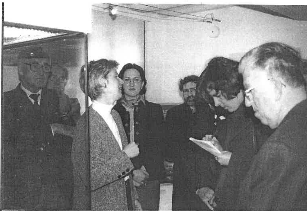
Sie fand aufmerksame Zuhörer.