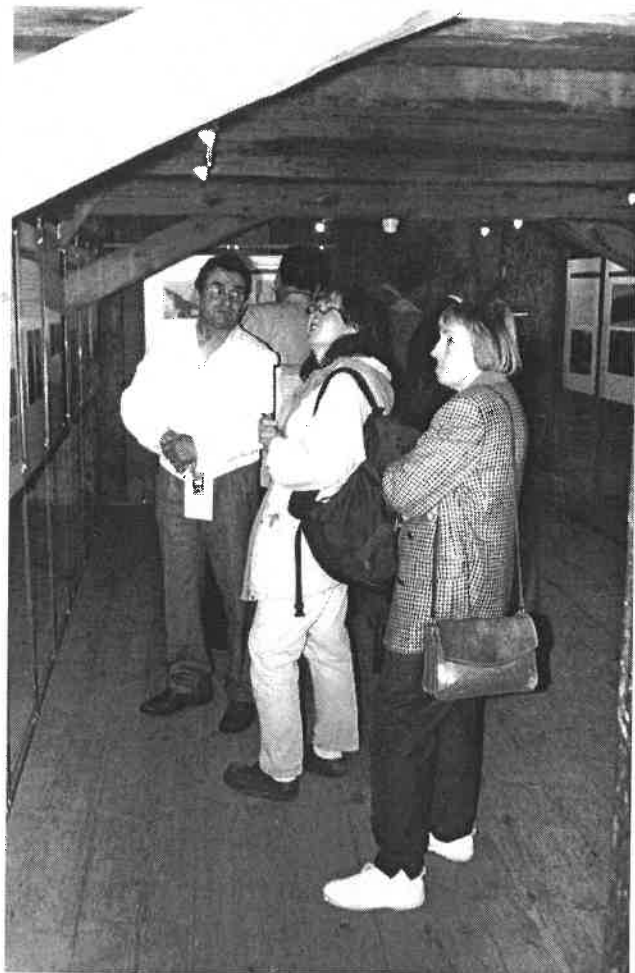
Darstellung der Hofgeschichte im Getreidespeicher des Hauses

Beim Kaffeetrinken im naheliegenden Landgasthof Pickel erfolgte nun: