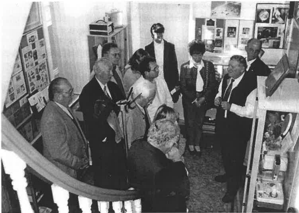
Diskussion im Treppenhaus über die Zukunft des Museums

Landkreis über, der die benachbarte Scheune hinzukaufte.